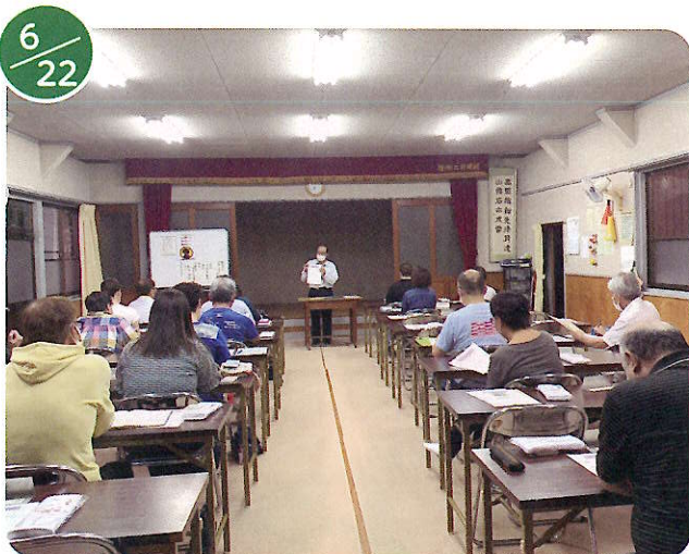
近隣ヶアグループ研修会