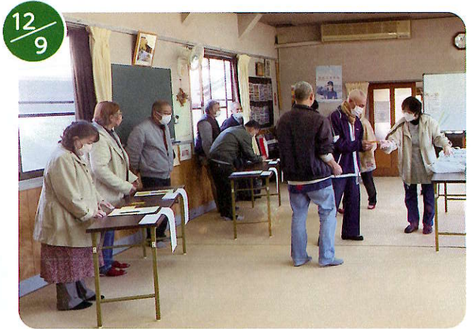
高齢者ふれあい交流会 80歳以上〈赤い羽根共同募金事業〉参加者70名