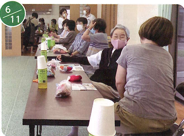
ふれあいサロン不動ヶ丘 (ボランティアハウス)

日頃より雄飛地区の皆様におかれましては、雄飛地区社協の各種事業にご理解とご協力を賜り有難うございます。昨年に続いて今年度もコロナ禍により事業そのものが中途半端に終わったものもあります。それでもご協力もあって「ご近所畑事業」や「健康増進教室」など無事に終えることができました。改めて参加者と関係者の皆様に感謝申し上げます。一部ではございますが写真にてご報告させていただきます。