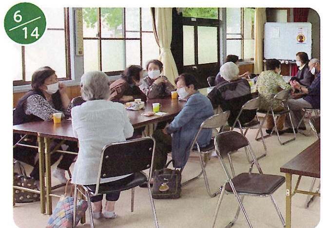
サロン雄飛ヶ丘 (ボランティアハウス)