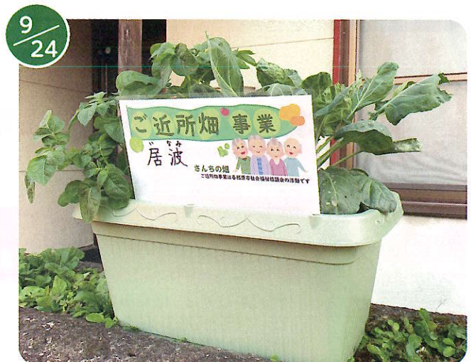
ご近所畑苗等配布